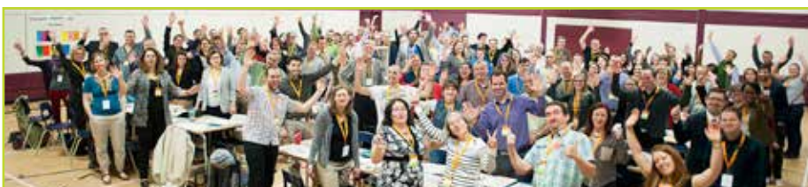
Les juges lors de la Super Expo-sciences Hydro-Québec, finale québécoise 2015 à Gatineau.