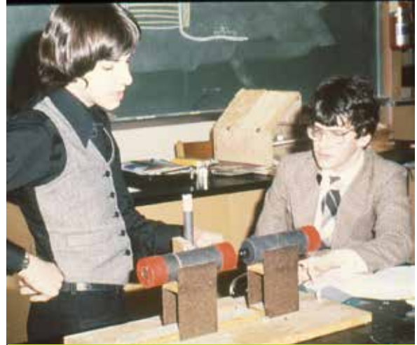
Un projet à l'Expo-sciences dans les années 70.

N'hésitez pas non plus à nous écrire pour partager avec nous vos bons coups ou toutes les nouvelles qui peuvent intéresser la communauté (nouvelle entreprise, partenariats d'affaires, naissances, mariages, etc.). Il nous fera plaisir de les partager sur Facebook , Twitter et dans le bulletin !